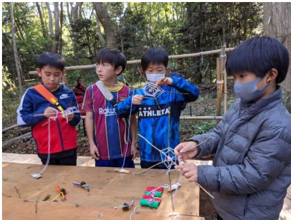
クモの巣づくりに挑戦