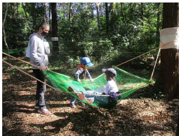
親子でハンモックを楽しむ