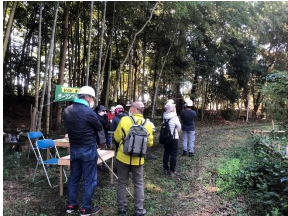
受付をして森の散策