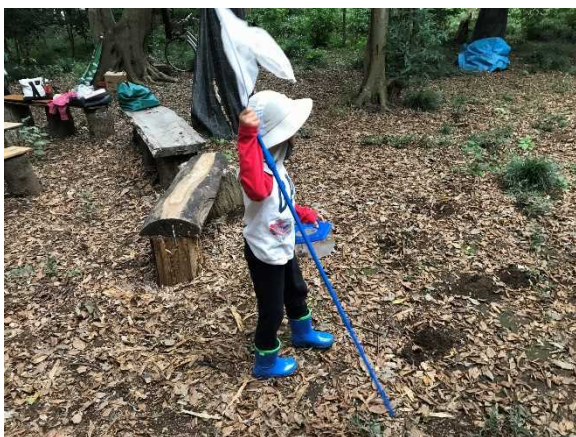
虫さんいるかなあ～