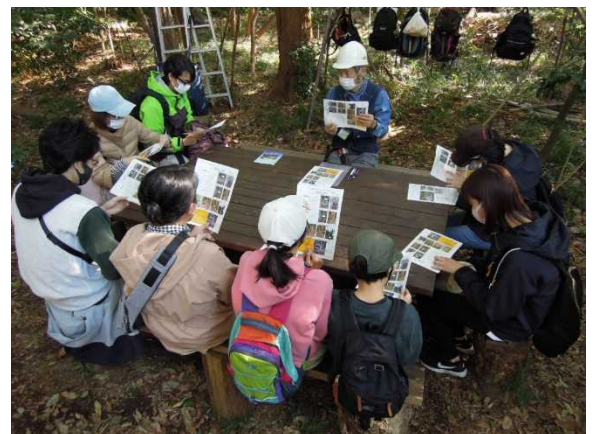
樹木探し迷路の説明を聞く訪問者の皆さん