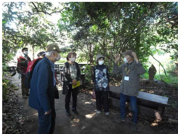
森の説明を聞く訪問者