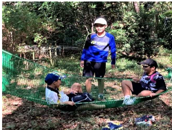
テニスの後 ハンモックで寛ぐ友達