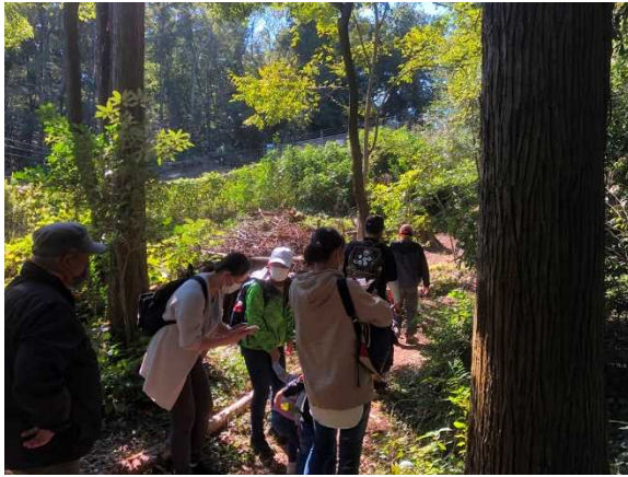
木漏れ日の森を散策