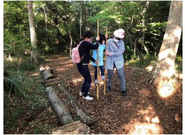
はじめての竹馬体験