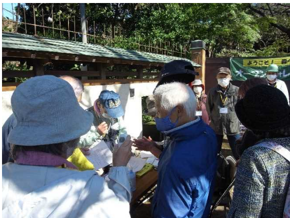
受付で検温、手指の消毒を・・・