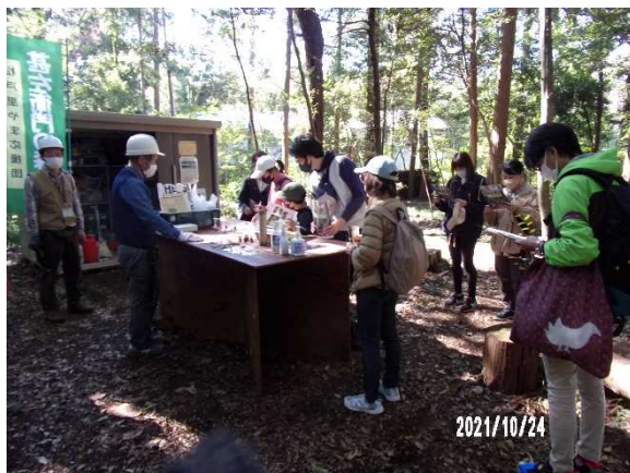
木漏れ日の中で検温・手指の消毒・・・