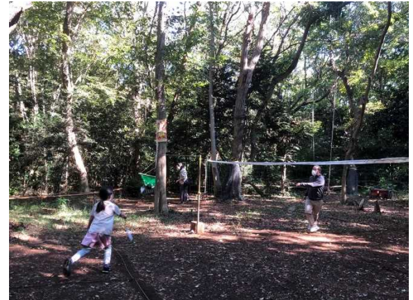
森でお父さんとバドミントン