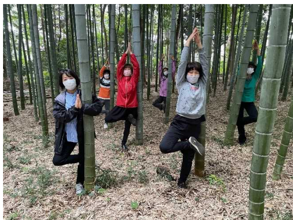
竹林でヨーガに挑戦